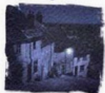
PAULO COELHO Le Démon et mademoiselle Prym