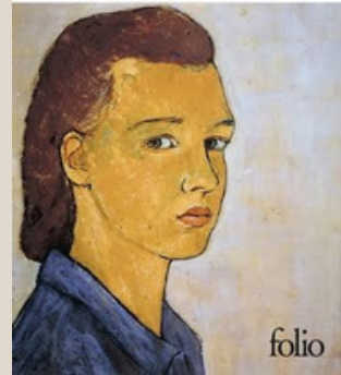
David Foenkinos Charlotte