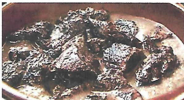
Gardiane de taureau Ecrasé de pommes de terre

Au profit du TELETHON Le Dimanche 5 décembre à partir de 11h30 à la salle des cigales